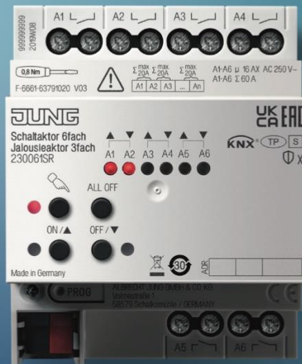
ACTUADOR DE CONMUTACIÓN KNX, 6 FASES ACTUADOR DE PERSIANAS KNX, 3 FASES

Nueva generación. Nuevas funcionalidades.