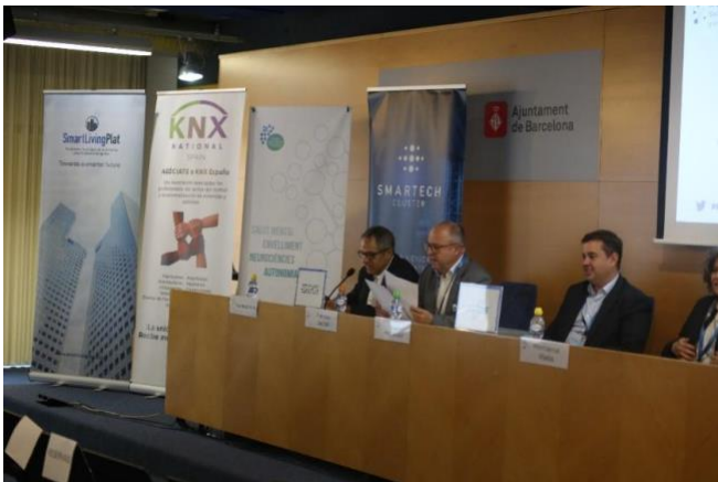
Mesas de debate durante las dos jornadas del Smart Technology Fórum